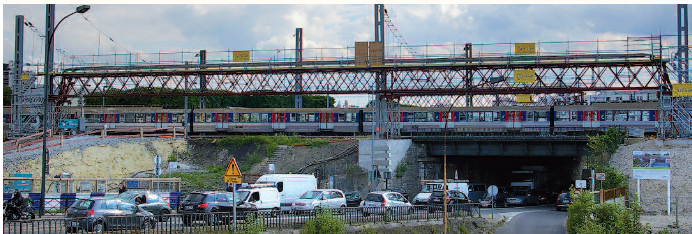
Passerelle le long des voies SNCF quais de Clichy à Levallois-Perret (92).